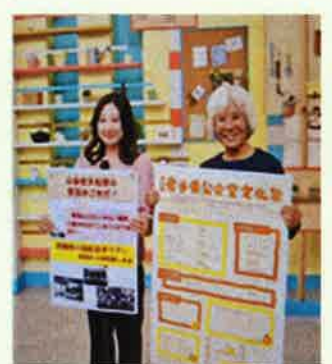
テレビ岩手「5きげんテレビ」で紹介しました