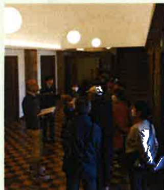
見学ツアー 大ホールホワイエ